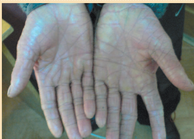
Рис. 5. Выраженная гиперлинеарность ладоней при вульгарном ихтиозе.