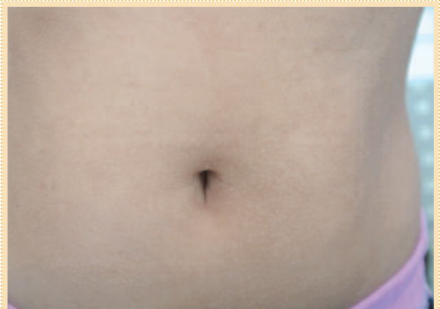
Рис. 6. Акцент фолликулярного рисунка при ксерозе кожи.