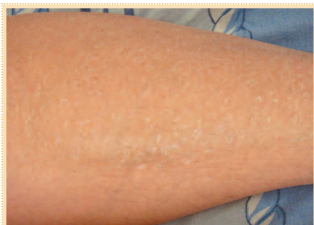
Рис. 1. Пластичатое шелушение кожи при ксерозе.

Целостность и непроницаемость рогового слоя во многом зависят от скорости десквамативных процессов, происходящих в поверхностных слоях кожи. Основными компонентами корнеодесмосом, соединяющих роговые пластинки, являются белковые структуры – протеины адгезии: десмоглеин 1, десмо-