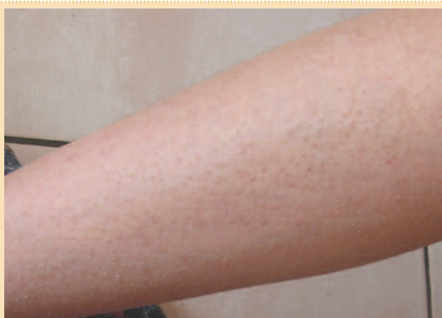
Рис. 7. Фолликулярный кератоз при вульгарном ихтиозе.