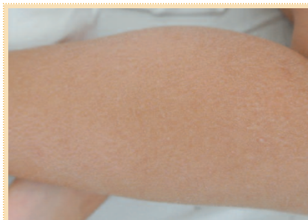
Рис. 2. Шелушение кожи при ксерозе.