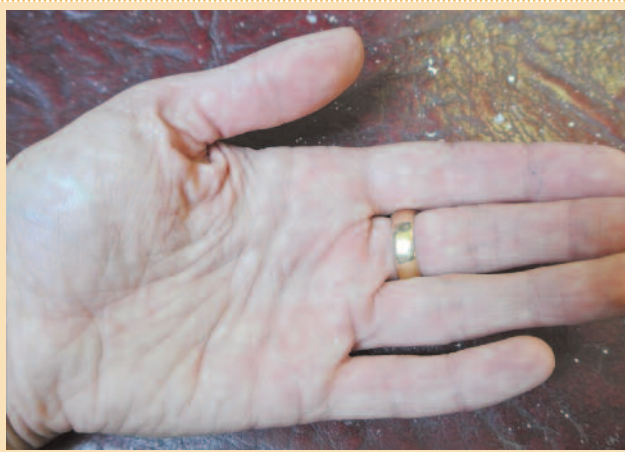
Рис. 3. Гиперлинеарность ладоней при ксерозе.